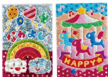
きらりんカードの完成図

一つ一つのパーツに色を重ねていく作業は、ぬりえのようにお子様の想像力や集中力を育てることができます。また、メッセージ入りのカードはお友達へのプレゼントとしても活躍してくれます。お友達とカードの交換ができたり、一緒に一枚のカードを完成させたりと、友達作りが不安になる新学期の頼もしいコミュニケーションツールとしてもおすすめです。