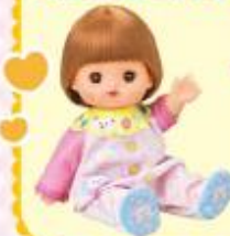
メルちゃんのいもうと ネネちゃん